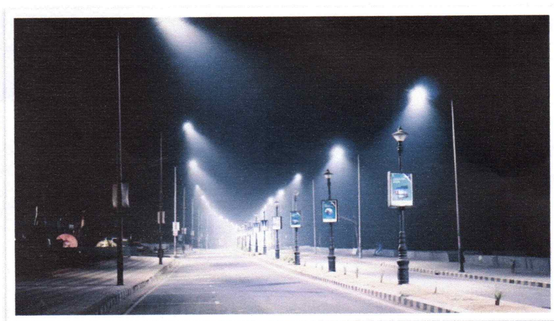
Poste de Iluminação Pública em LED.