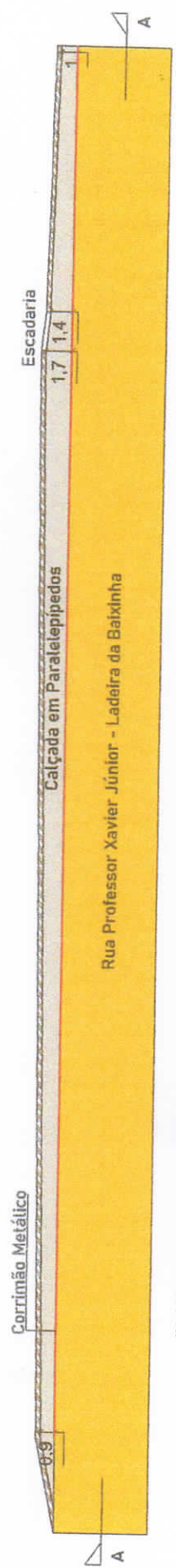
PLANTA BAIXA ESCALA 1:200